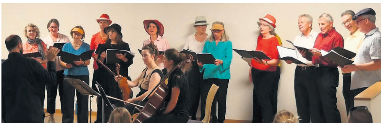
Das Chorprojekt 2023 ist abgeschlossen, der Rahmen für das nächste Projekt wird bereits geplant.